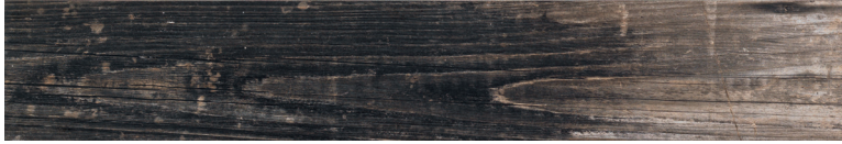
OREGON FUME Size: 7.9×47.2"