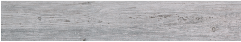
OREGON RUSTIC BIANCO Size: 7.9x47.2"