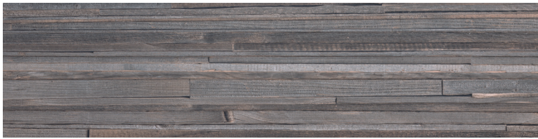
OREGON AGATA DECO Size: 11.8x47.2"