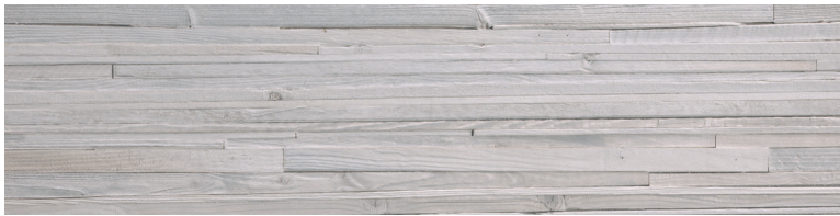
OREGON RUSTIC BIANCO DECO Size: 11.8x47.2"