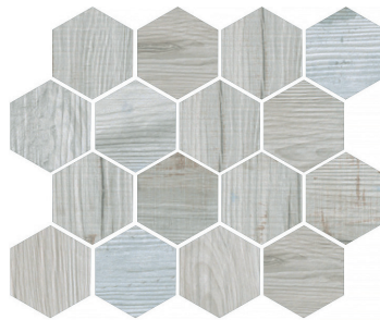
OREGON WHITE WOOD HEX Size: 9.8×11.8"