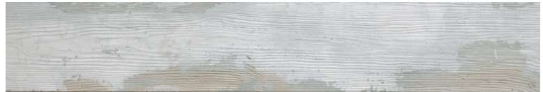
OREGON WHITE WOOD Size: 7.9×47.2"