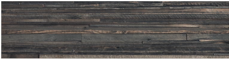
OREGON FUME DECO Size: 11.8×47.2"