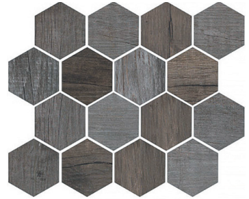
OREGON AGATA HEX Size: 9.8x11.8"