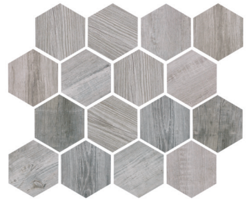
OREGON RUSTIC BIANCO HEX Size: 9.8x11.8"