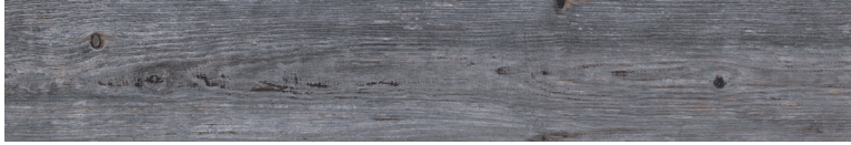
OREGON AGATA Size: 7.9x47.2"