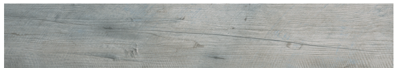
OREGON GREY WOOD Size: 7.9×47.2"