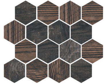
OREGON FUME HEX Size: 9.8×11.8"